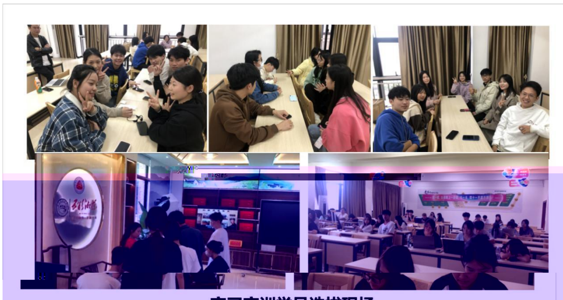
同学们在课堂上进行实训